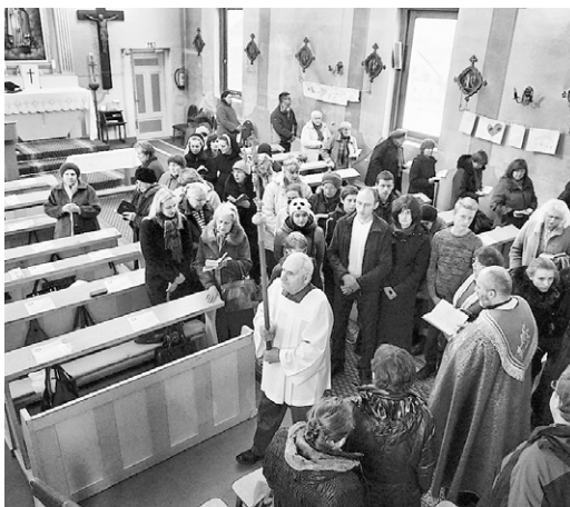
Krustaceļš 11. martā, ko vadīja jaunieši.