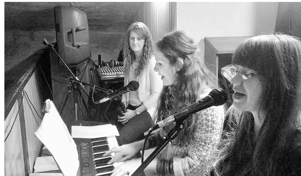
Slavēšana Madonas katoļu baznīcā.