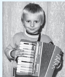
Esot c-moll`a (pēc uzvārda), spēlēju C-dur!

Lai Dievs dod, ka es vēl biežāk un ar lielāku mīlestību slavētu Viņu un Mariju ar dziesmām un dzīvē! „18...pildiet sevi ar Svēto Garu! 19. Dziedādami un gaviļēdami skandiniet savās sirdīs Kungam psalmus un slavas dziesmas, un garīgās dziesmas.” (Ef 5)