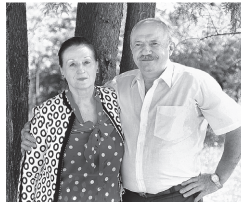
“Skaidri redzams, ka tas ir Dieva darbs, bet dēls visā elicis arī daudz pūļu.”

– Latvijā pamanīju, ka jums ir liela lūgšanu degsme, – vērtēja Pāvila tētis. – Latvijā priesteru persona ir daudz vairāk cienīta, Polijā priesteri ir tuvāk cilvēkiem, viņi savstarpēji kontaktējas, šeit distance ir lielāka. Redzu, ka Latvijas draudžu dzīvē būtu nepieciešama lielāka laju iesaistīšanās, baznīcās ir saimnieciska un materiāla atbalsta vajadzība. Ja dēls ļaus, braukšu uz Madonu vēl, lai palīdzētu praktiskos darbos (elektrības, santehnikas sakārtošana), kas piemēroti man. Priecājos, ka