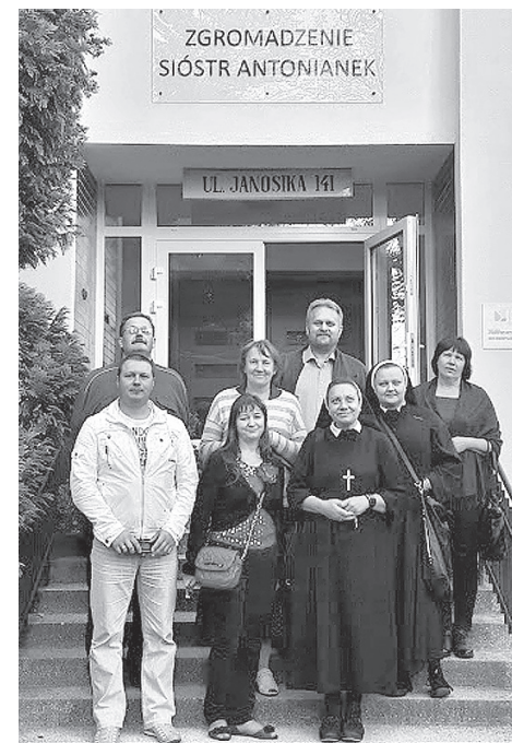
Gustavskolas projektā iesaistītie kopā ar poļu klostermāsām.