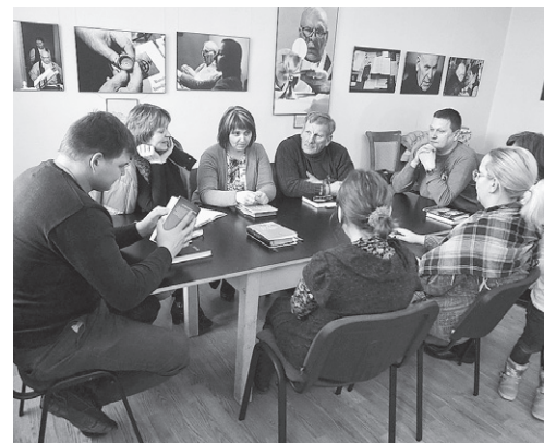
Mirklis no mazo grupu darba.

tību, uzticamību, lēnprātību un atturību. Bija arī mazo grupiņu darbs, lai pārrunātu dzirdēto, brīvais laiks, lai iekārtotos naktsmājās, atpūstos, apskatītu baznīcas dāru un sakrālo laukumu. Dienas otrajā pusē uzmanība tika veltīta jautājumam, kā katrs var tikt piepildīts ar Svēto Garu. Sekoja slavēšana un Svētā Gara piesaukšana, kā arī iespēja šai nodomā saņemt aizlūgumu. Dienas nobeigumā baudījām atpūtu, spēlējot spēles un vairāk iepazīstot cits citu. Starp mums bija dzimšanas dienas