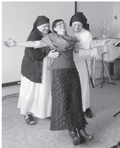
Mirkļis no rekolekcijām. Paļāvība.

Jā, bija skaidrs, ka mūsu dzīves mērķis ir Dievs, bet... cik mēs Dievam ļaujam darboties sevī? Cik uz Viņu paļaujamies? Pa īstam, atmetot savus plānus, kā kāpjot bezdibeni un esot pilnīgi pārliecinātai, ka Dievs mūs noturēs? Cik spējam ikdienā paturēt prātā, ka Dievs redz savādāk? It sevišķi pārdzīvojumos un grūtībās, uzturot domu, ka Jēzus padalās ar mums savā krustā, kuru Viņš nesa nekurnot un nevienu neapsūdzot. Cik mēs spējam nemeklēt vainīgos mūsu problēmās?