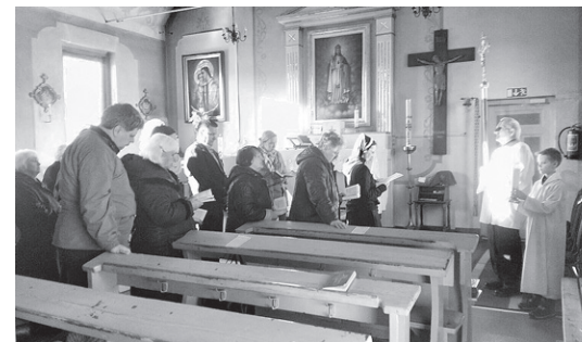
Mirkļis no Krustaceļa Nedzimušā bērna nodomā.

kas ved pie Dieva. Tas ir ceļš, lai satiktu Viņu, iemilētu Viņu un Viņam mīlestībā kalpotu. Tas nav viegls ceļš, jo ir jābūt drosmīgam, lai atstātu visu, kas traucē vienotībai ar Viņu, un sekotu Viņam, pieņemot arī grūtības, bezcerību un nezināmo, un no sirds ticētu, ka DIEVS IR, un Viņš nav mūs atstājis.