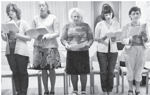
Rekolekciju laikā skan laudes.

Droši vien ( kaut neviens nezina, kā īstenībā bija) Dievs mūs plānoja caur gadu tūkstošiem. Ar to domāju gadu neskaitāmo skaitu, jo Dievs jau nepazīst laiku. No mūžības Radītājs, ja vispār tādā veidā varam par Viņu domāt, iecerēja, kā mums vajadzētu izskatīties, kādiem būt, lai mūsos izpaustos Viņa nebeidzamais skaistums. Taču kādā „brīdī” Viņš saprata, ka visas lieliskās idejas viena cilvēka projektā ietvert nav iespējams. Ja vēlas