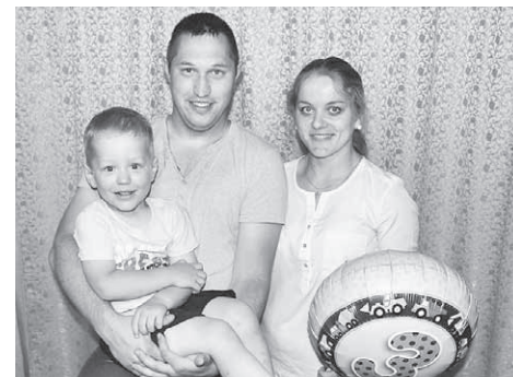
Ikaunieku ģimene šā gada 30. jūnijā – dēla trešajā dzimšanas dienā.