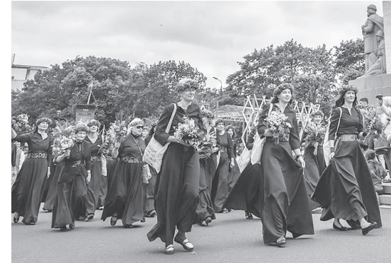
Siguldas draudzes koris Vispārējo latviešu Dziesmu un Deju svētku gājienā Rīgā, 2018. gada vasarā.

– Jutos ļoti īpaši sagaidīta – rūpes par koristiem bija augstā līmenī. Cilvēki bija atvērti, smaidīgi un ar vēlmi dalīties. Dziedot jutu, ka Dieva klātbūtne stiprina katru no