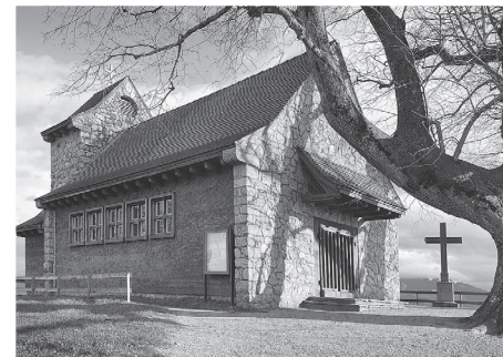
Baznīca Lucernas apkārtnē Šveicē.

kā skaistu rotājumu. Mises baznīcās notiek reti, nav priesteru un ticīgās tautas; lai piedalītos dievkalpojumā, ir jādodas uz lielāku pilsētu.